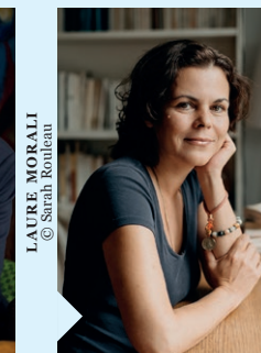
LAURE MORALI © Shirah Kondeau