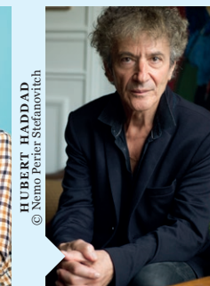
HUBERT HADDAD