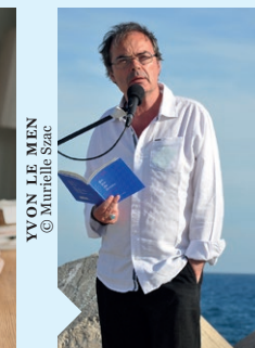
YVON LE MEN © Murielle Szac