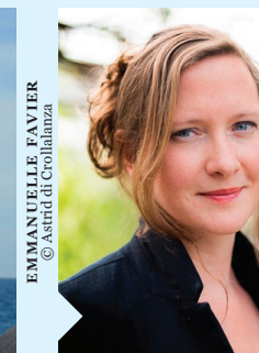
EMMANUELLE FAVIER