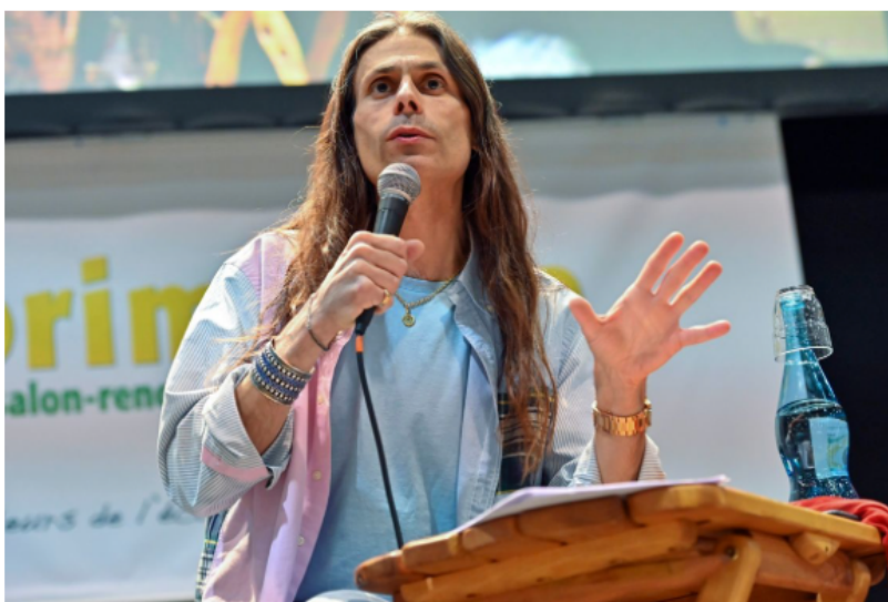
L'astrophysicien Aurélien Barrau à la 34e édition du salon Primevere, salon de l'alter écologie, 6 mars 2020.

Aurélien Barrau est astrophysicien, directeur du Centre de Physique Théorique Grenoble- Alpes et il est aussi un ardent défenseur de la planète. Il est l'auteur de "Il faut une révolution politique, poétique et philosophique" (éditions Zulma).